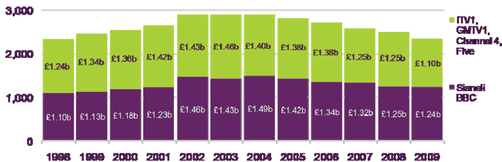
Ffigur 4 Gwariant ar raglenni gwreiddiol tro cyntaf rhwydwaith DGC 14 , 1998-2009, 2009 (yn ôl prisiau 2009)

Ffynhonnell: Ofcom/Darlledwyr. Nodyn: mynegir y figurau yn ôl prisiau 2009. Mae figurau ar gyfer y BBC yn cynnwys BBC 1, BBC2, BBC3, BBC 4, CBBC, CBeebies, BBC News, BBC Parliament. Nid yw'r dadansoddiad yn cynnwys S4C na BBC HD. Nid yw'r figurau'n cynnwys rhaglenni'r cenhedloedd/rhanbarthau.